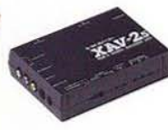
S端子用TV専用 RGBアダプター P-1210