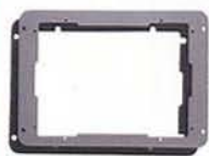
表示部用インダッシュパネル P-1001